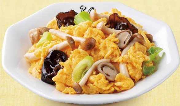
【玉子ときのこ炒め】 価格：本体価格420円＋税