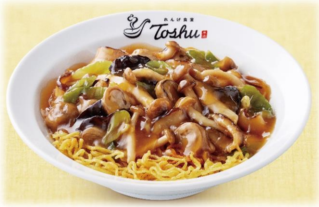
【きのこあんかけ焼きそば】 価格：本体価格630円＋税